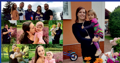
Rodiče a kbelské děti

Jsmo velmi znepokojeni tím, že úřad povoluje výstavbu bytových domů bez toho, aby získal benefity ve formě například bytů pro vlastní potřeby a také nepožaduje úpravu a rozšíření stávajících komunikací. Naším cílem je dále udržet ve vlastnictví bytový fond městské části, dobře hospodařit s byty a vytvářet možnosti pro případnou další bytovou výstavbu či opravu stávajících bytů. Chceme vytvořit podmínky i pro mladé páry a umožnit jim dostupné nájemní bydlení nebo mít k dispozici menší startovací byty. Pozemky, které ještě vlastní obec, neprodávat, ale smysluplně využít pro vlastní výstavbu či pronájem. Vedení radnice musí zvážit, zda je v zájmu Kbel se dále rozšiřovat a zvětšovat, zda je schopno obyvatelům Kbel zajistit podmínky pro kvalitní život, kvalitní dopravu, bydlení, služby, školu, školku, zdravotnictví a další občanskou vybavenost.