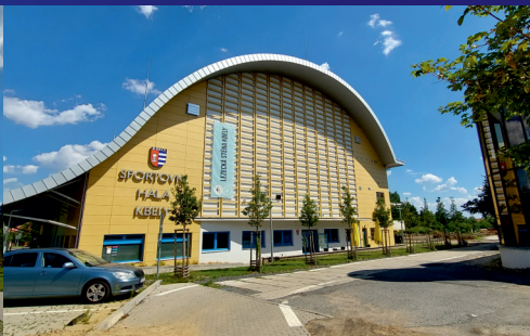
Sportovní hala s fotovoltaikou